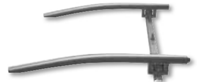
62 cm: 2603