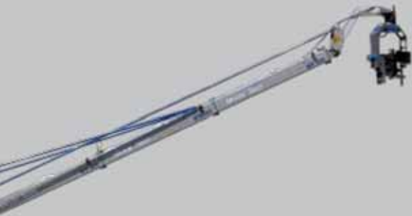
mit Remote Head with remote head