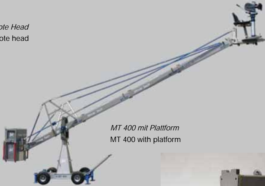
MT 400 mit Plattform MT 400 with platform