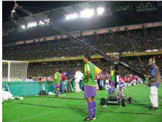
Football World Cup 2002 and 2006

Felix Kran Dolly mit ABC-Products Kran 120 Felix Crane Dolly with crane 120