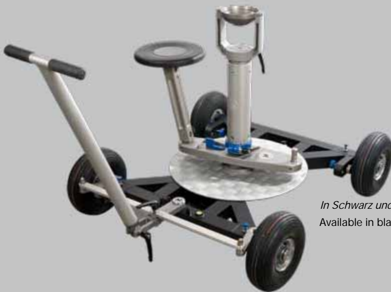
In Schwarz und Silber erhältlich Available in black and silver