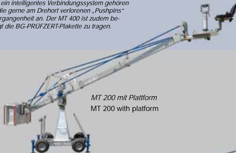
MT 200 mit Plattform MT 200 with platform

Mit nur zwei verschiedenen Abstreungs- sowie Parallelogrammstangen und entsprechenden Kranarmsegmenten in 1m und 1,5m Länge, besticht die MT-Kranserie durch seine enorm kurzen Rüstzeiten. Durch ein intelligentes Verbindungssystem gehören auch die gerne am Drehort verlorenen „Pushpins“ der Vergangenheit an. Der MT 400 ist zudem berechtigt die BG-PRÜFZERT-Plakette zu tragen.