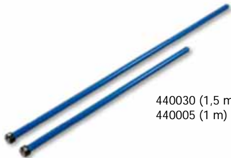
440030 (1,5 m)