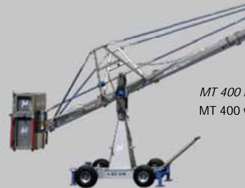
MT 400 MT 400